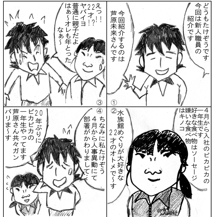
TAKEZOUの4コマ漫画 ～生活に笑いを届けます～