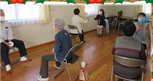
11月20日穂波温泉区お茶飲み会