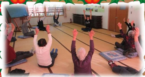
11月11日たっしやでくらそう会