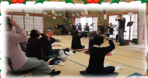
11月5日宇木いきいきサロン

9月下旬以降、新型コロナウイルスの感染状況が落ち着いてきたことから、各サロンの活動が再開されました。11月は計6団体のサロン開催があり、約1年ぶりの開催団体もありました。参加者の皆さんは音楽鑑賞や軽運動などを行い、久しぶりのサロンを楽しまれました。なお、今年度末までにサロン全17団体のうち約9割が活動再開や活動見込みです。飲食はまだ出来ない状況ですが、町社協では今後も感染状況に注意しながらサロン活動を支援して参ります。