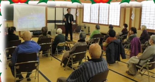
11月27日上条区おたっしや会