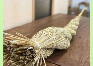
しめ縄作りの様子