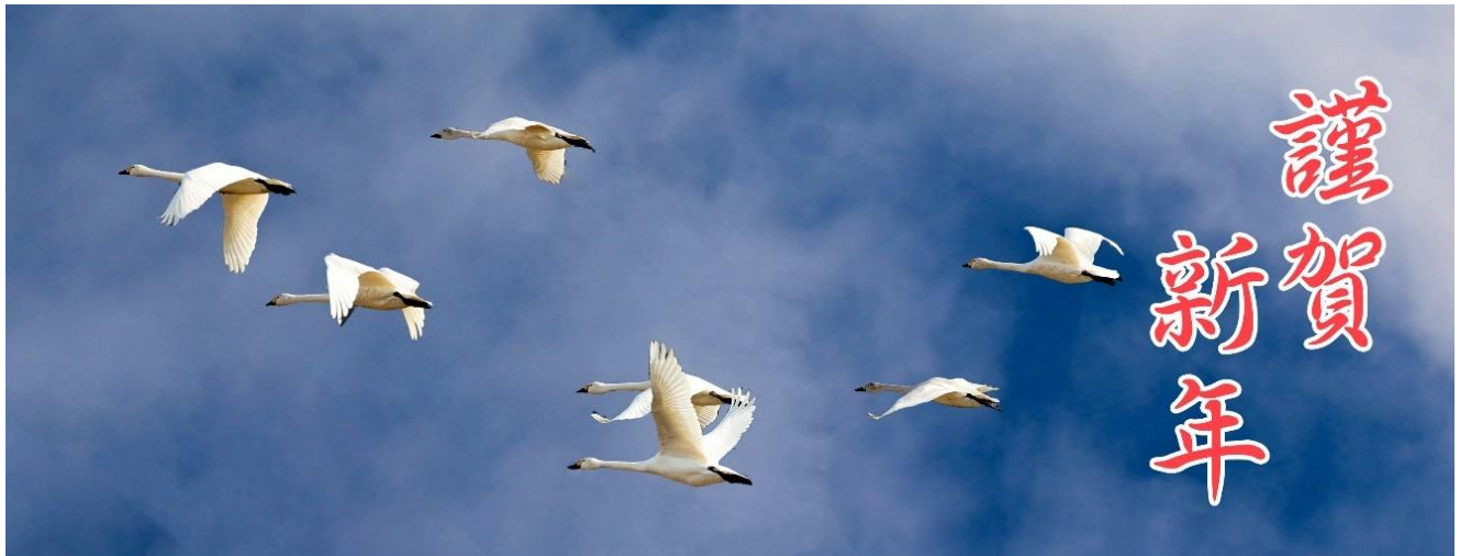
「飛翔～コハクチョウ～」

新年あけましておめでとうございます。今年も清新な中にも様々な思いをもって新年を迎えられたことと思います。