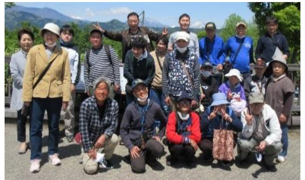
写真：5月8日 小布施総合公園にて