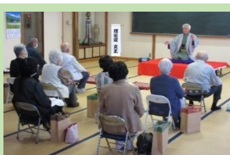
上条区おたっしゃ会 6月12日(日) 落語鑑賞

町内の各いきいきサロンでは、新型コロナウイルスの感染状況に注意しながら活動を行っております。このうち、6月は4団体が活動しました。また、7月については、6団体が活動予定です。町社協では、各団体の要望を踏まえながらサロン活動を支援して参ります。