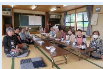
いちご会 6月15日(水) 軽運動