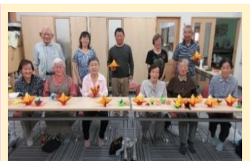
ひだまり亭 6月16日(木) おりがみ教室