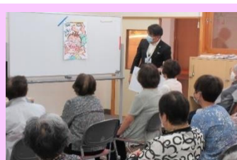
星川お元気会 6月16日(木) 脳トレ