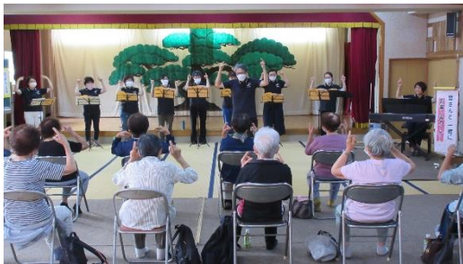
9月17日：本郷区いきいきサロンの様子

8月下旬、新型コロナウイルス感染が低下し、町内各所でいきいきサロン活動が再開しました。各団体では感染防止のため、飲食を伴わず短時間の開催ではありますが、役員の皆さんが工夫を凝らしサロン活動を進めています。引き続き、町社協も感染防止対策等を行った上でサロン活動の支援を行って参ります。